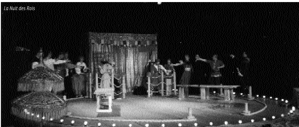
La Nuit des Rois