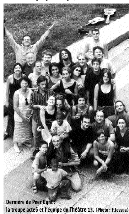
Dernière de Peer Gynt : la troupe acte 6 et l'équipe du Théâtre 13.